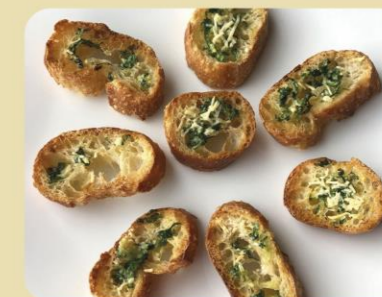
PA TORRAT AMB ALL I FORMATGE AMB JULIVERT