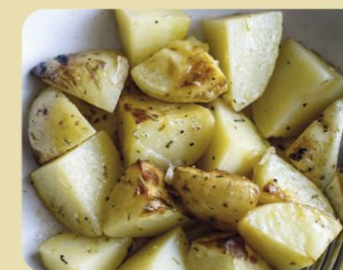
CREÏLLES AL FORN AMB ROMER

Utilitzar espècies en la cuina ens ajuda a millorar el sabor dels nostres plats a més d'afavorir l'acceptació d'aliments que agraden menys als més menuts. Us animem a utilitzar-les a casa amb les següents receptes: