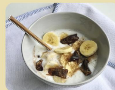
IOGURT AMB DÀTILS, PLÀTAN I CANELLA