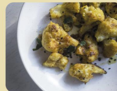
COLIFLOR ESPECIADA AMB TIMÓ AL FORN